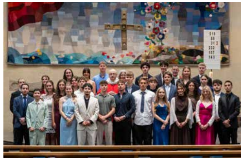
Bild: Firmung 2026