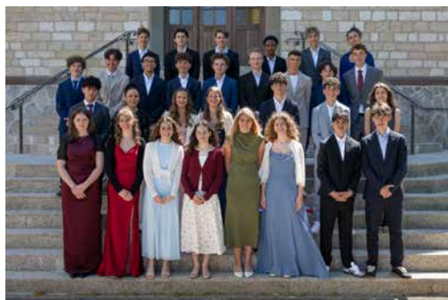
Unsere Firmanden und Firmandinnen

Die Liste ist lang und das Herz voller Dank für die wunderbare Firmfeier am Sonntag, 14. Juni. Die Mitarbeitenden der Pfarrei, der Firmspender Christian Schaller, die Pfadi, die Gäste sowie die Eltern und Verwandten, die in kürzester Zeit ein wunderbares singendes Geschenk für die Gefirmten auf die Beine gestellt haben, sie alle machten diesen Tag unvergesslich. Auch die Jugendlichen selbst zeigten eine starke Präsenz und haben dazu