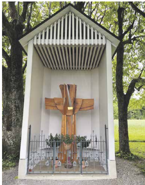
Die Buschbergkapelle steht an einem idyllischen Ort und hat kürzlich ein neues Kreuz bekommen, das der Künstler Samuel Freiburghaus in doppelter Ausführung gestaltet hat.

An diesem Ort, wo Menschen seit vorgeschichtlicher Zeit Spuren hinterlassen haben, darf der Wald heute ungestört von menschlichen Eingriffen wachsen. Das Naturwaldreservat Tiersteinberg wird nicht bewirtschaftet, so dass alte Bäume umstürzen und Tier- und Pilzarten Lebensräume im Totholz finden. Der