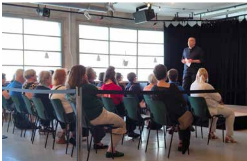
Die kurzen Eröffnungsreden stellten die Wichtigkeit der Freiwilligenarbeit heraus: Als Gegengewicht zu immer grösserer