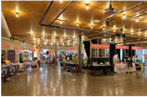
Offene Kirche Elisabethen, Fasnachtswelt, Wilde Nachbarn beider Basel oder die Blindenhundeschule: Basel ist sozial und engagiert sich breit aufgestellt freiwillig.

Dieser Satz trifft wohl den Nagel auf den Kopf. Sehr kurzfristig und unter dem Motto «einfach mal machen» hatte die Spezialseelsorge im März entschieden, an der ersten Freiwilligenmesse in der Markthalle präsent zu sein. Mehr als 40 verschiedene Organisationen aus Basel und der Region präsentierten sich und ihre Arbeit.