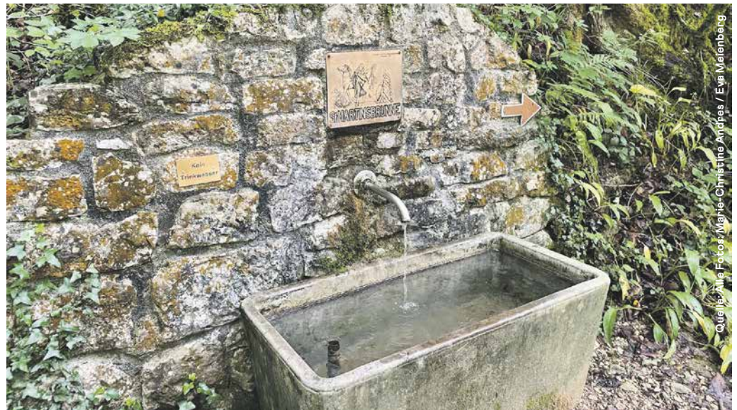
Obwohl das Martinsbrünneli fast ein wenig unscheinbar am Waldweg steht, soll sein Wasser es in sich haben.

Auf den Hügeln rund um Wittnau reifen die Kirschen. Hier ist auch das Holz gewachsen,