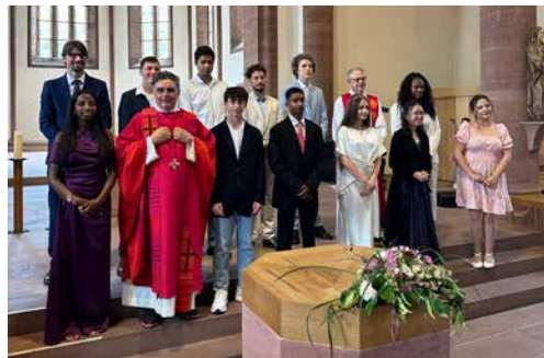
Die Firmanden im Altarraum

Am 31. Mai wurden 12 junge Menschen in der Clararkirche gefirmt. Domherr René Hügin fand für jeden der Namen eine passende Geschichte und verdeutlichte die Schlüsselposition jedes Einzelnen in dieser Welt.