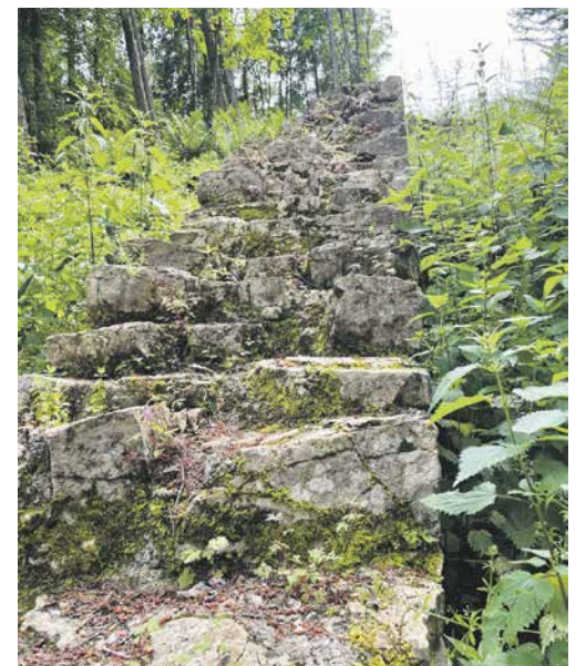
Auf dem Wittnauer Horn finden sich Zeugen menschlicher Besiedelung von vorgeschichtlicher Zeit bis ins Mittelalter.

Die Bänke im Halbkreis um die Lourdesgrotte laden zum Verweilen ein. Hier wacht Maria, und Bernadette von Soubirous kniet mit gefalteten Händen zu ihren Füßen. Die Lourdesgrotte ist eine von vielen in den Fricktaler Gemeinden. Aus einem Stein neben der Gotte ragt ein Wasserhahn, der kläglich vor sich hin tropft. Eine Freiwillige der Grottenkommission, die gerade den Behälter mit den Kerzli auffüllt, bemerkt das. Sie schiebt ein paar