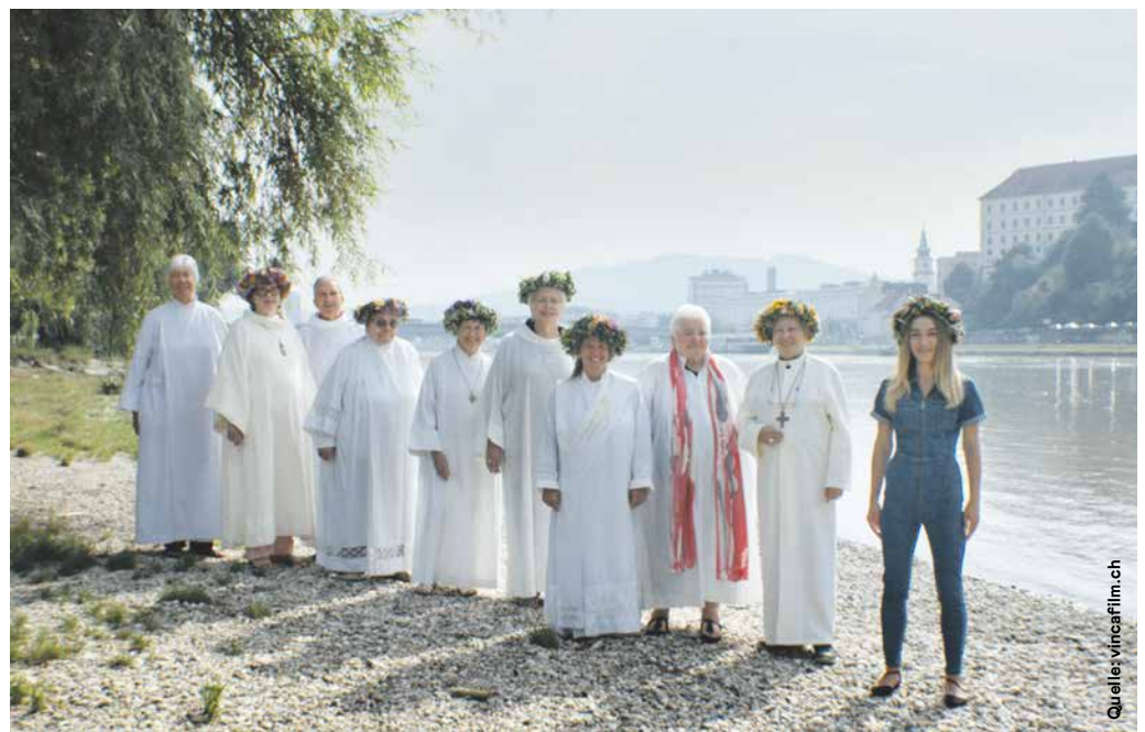
Inna Shevchenko trifft römisch-katholische Priesterinnen in Linz an der Donau. Filmbild aus «Girls and Gods»