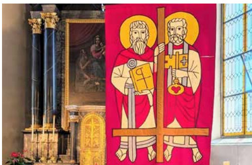
Bild: Fahne mit unseren Schutzpatronen