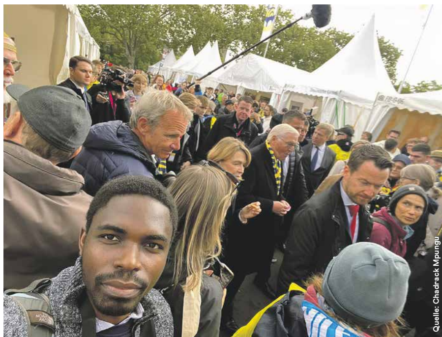
Die Gelegenheit für ein Selfie mit dem deutschen Bundespräsidenten Frank-Walter Steinmeier auf der Kirchenmeile liess sich Chadrack Mpungu nicht entgehen.

Während wir im Kongo mit dem ganzen Körper feiern, diskutiert Würzburg vor allem mit dem Kopf. Es ist eine andere Art, Christ zu sein. Intellektueller, aber nicht weniger aufrichtig. Als Chorleiter ist mein Gehör fein eingestellt; die spirituellen Momente und Konzerte haben mich berührt. Wenn Stimmen und Melodien harmonisierten, wurde Glaube greif-