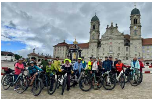
Die Velofahrer vom letzten Jahr.

Die Velowallfahrt nach Einsiedeln geht in die nächste Runde. Nach den wetterbedingten Herausforderungen im vergangenen Jahr, wagen wir 2026 einen neuen Anlauf und freuen uns auf viele velobegeisterte Pilgerinnen und Pilger.