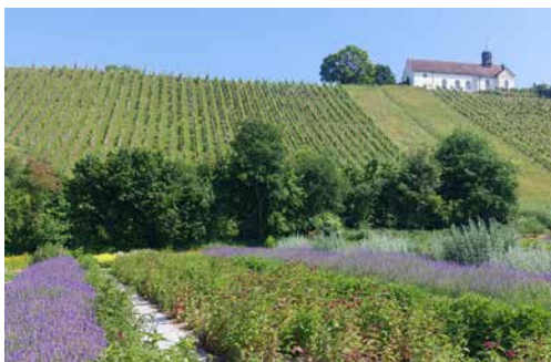
Personalausflug 2025, Garten der Kartause Ittingen