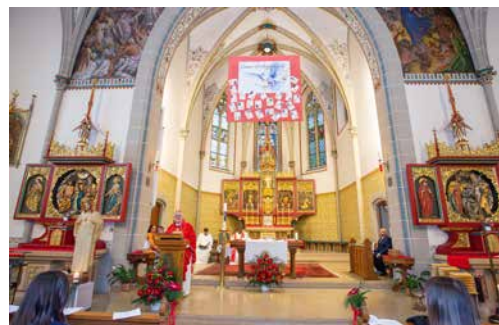
Bild: Firmung 2025

Am Samstag, 30. Mai um 17 Uhr dürfen 18 Jugendliche in unserer Pfarrei ein besonderes Sakrament empfangen: die Firmung. Dieses wichtige Ereignis im Leben junger Christin-