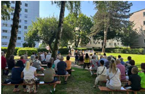
Bild: Fronleichnam 2025

Am Fest von Fronleichnam versammelt sich unsere Pfarrei zu einem besonderen Gottesdienst und zu einem gemeinsamen Weg durch die Gemeinde – ein sichtbares Zeichen des Glaubens und der Gemeinschaft.