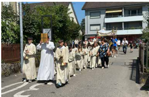
Bild: Prozession 2025, Spreitenbach