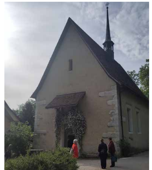
Kapelle zu Kreuzen (Pfarrrei St. Clara)

Pünktlich ging es vor der Clarakirche im Car Richtung Solothurn, wo oberhalb der Verenaschlucht die "von Roll-Kapelle" für einen Gottesdienst auf uns wartete, in der wir genau Platz fanden.