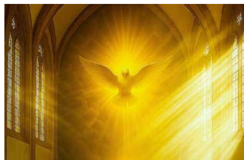
Die Taube als Zeichen des Heiligen Geistes (Bild: Philipp Christen mit leonardo.ai)