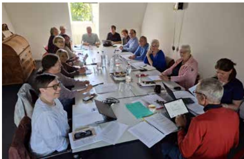
Die Mitglieder des Kirchenrates sowie Vertretende aus der Pastoral (Pfarreien,

Diese Sitzung begann anders als sonst, denn es waren auch Vertreter:innen der Pfarreien und anderssprachigen Gemeinschaften sowie der Spezialseelsorge anwesend.