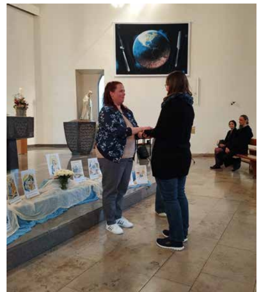
«Maria begleite dich»