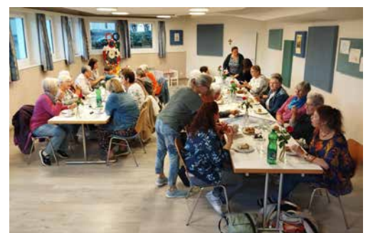
Gemütlicher Ausklang mit Kaffee und Kuchen