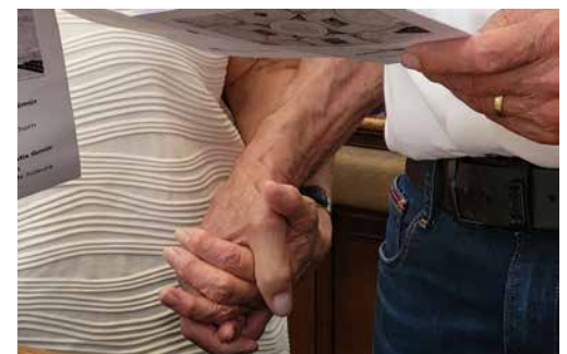
Goldene Hochzeit

zu einem Festgottesdienst ein. Am Samstag, 5. September 2026 um 15 Uhr in der Kathedrale St. Urs und Viktor in Solothurn. Anschliessend Kaffee und Kuchen in der Mensa der Kantonsschule Solothurn. Bitte melden Sie sich bei Interesse beim Pastoralraumsekretariat in Gebenstorf.