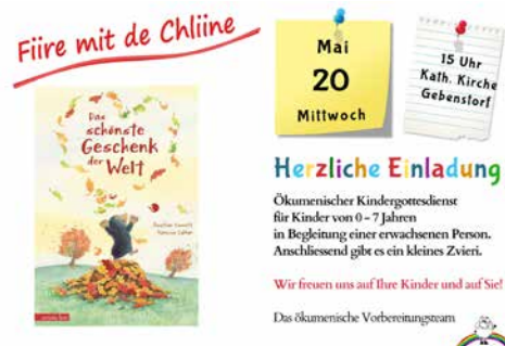
Das ökumenische Vorbereitungsteam