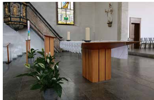
Heutiger Altar in Kirchdorf