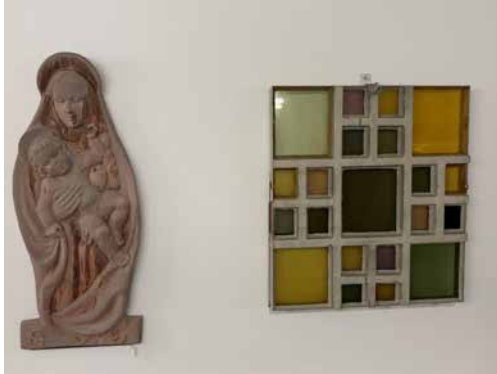
Bild: Fenster und Relief Maria mit Kind alte Kirche Nussbaumen, Dominik Schenker

herzlich eingeladen! (Bitte beachten Sie auch die Publikationen in der Tagespresse!) Archivkommission des Pastoralraums