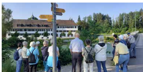
Kloster Gnadenthal