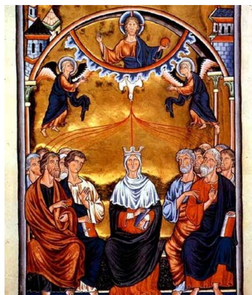
Darstellung von Pfingsten im Ingeborg-Psalter (um 1200)

Komm, Heiliger Geist, erfülle die Herzen deiner Gläubigen und entzünde in ihnen das Feuer deiner Liebe.