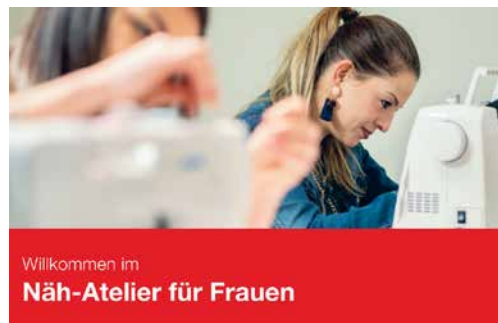
Willkommen im Näh-Atelier für Frauen