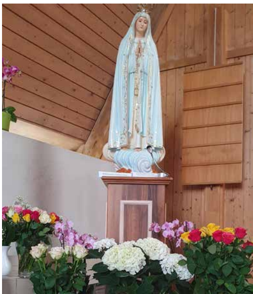
Die Pilgermadonna, 2 Tage nach Ihrer Ankunft, bereits reichlich mit Blumen geschmückt.

Ein ausführlicher Bericht erscheint im nächsten Lichtblick nach dem Wochenende mit der Marien-Prozession und weiteren Feierlichkeiten.