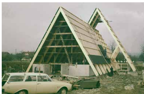
Eine zeltförmige Notkirche aus Holz.

Am Sonntag, 28. Juni feiern wir das 60-Jahr-Jubiläum der Pauluskirche anlässlich des Patroziniums. Am Auffahrtstag, 19. Mai 1966, wurde die Kirche durch Pfarrer Eugen Vogel und den Abt des Klosters Disentis, Viktor Schönbächler, gesegnet und eingeweiht.