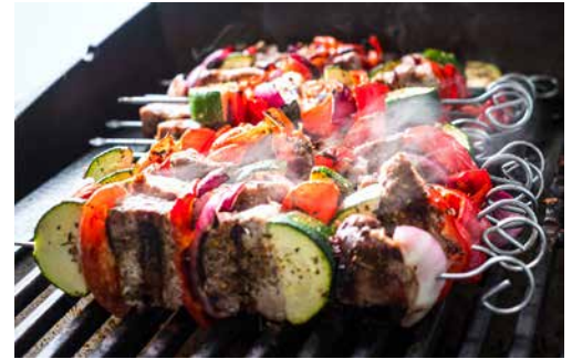
Samstag, 30. Mai, 15 bis ca. 19 Uhr, Pfarreigarten der katholischen Kirche St. Nikolaus, Brugg