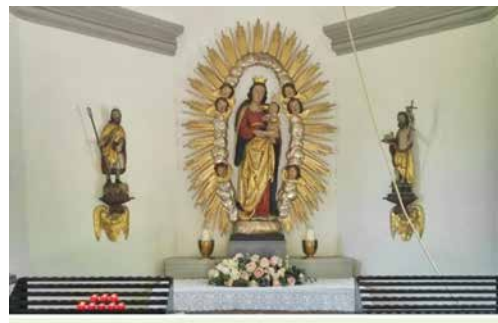
Maiandacht der Frauengemeinschaft, Donnerstag, 28. Mai, 17 Uhr

Anschliessend lädt die Frauengemeinschaft ein zum gemütlichen Beisammensein im kleinen Saal des Pfarreizentrums.