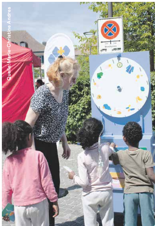
Das Lebensrad war ein Kindermagnet und eine Möglichkeit, mit den Eltern ins Gespräch zu kommen.

gau eine Organisation gibt, die sich fundiert mit Fragen zum Lebensende beschäftigt. Die Strassenaktion ist der Auftakt zur Kampagne «Endlich Antworten». Die gesammelten oder schriftlich eingereichten Fragen werden von Fachleuten in einer fortlaufenden Videoserie beantwortet, die im Oktober 2026 startet. Ende Oktober findet zudem eine Aktionswoche statt, in der ausgewählte Publikumsfragen zum Veranstaltungsthema werden.