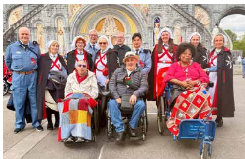
Ein Teil der Basler Sektion in Lourdes, 1.-5. Mai 2026

Nachdem auch in diesem Mai wieder drei Personen aus Reinach an der internationalen Lourdeswallfahrt der Malteser mitgeholfen haben, freuen wir uns, die Basler Sektion des Malteser Hospitaldienstes Schweiz in der Abendmesse am Donnerstag, 21. Mai, zu begrüssen.