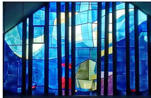
Dorfkirche St. Nikolaus