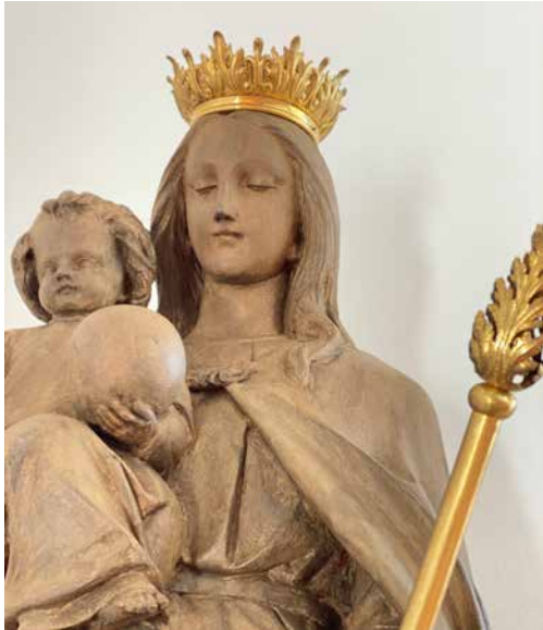
Bild: Marienstatue in der Kirche St. Johannes der Täufer