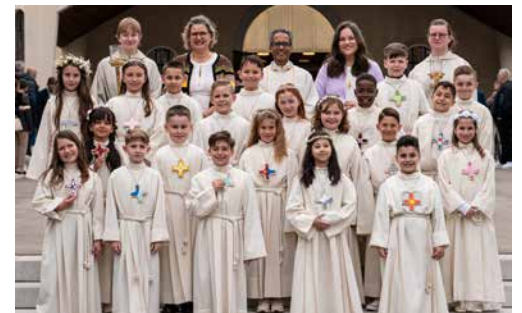
Erstkommunionkinder aus Oftringen und Safenwil

In den feierlichen Gottesdiensten durften die Erstkommunionkinder schliesslich zum ersten Mal die heilige Kommunion empfangen. In diesem besonderen Moment wurde die Verbindung zu Jesus im Brot des Lebens auf eine neue, tiefere Weise erfahrbar.