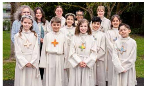
Erstkommunionkinder aus Brittnau und Strengelbach

Am 12. und 19. April durften wir in unserer Pfarrei ein besonderes Fest feiern: Die Erstkommunion von insgesamt 59 Kindern aus Strengelbach, Brittnau, Safenwil, Oftringen und Zofingen. Unter dem Thema «Mit Jesus verbunden» kamen die Kinder mit ihren Fa-