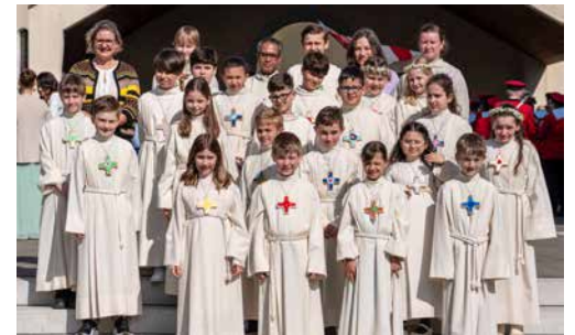
Erstkommunionkinder aus Zofingen

So erzählten die Ähren von Freude, Hoffnung und von Zeiten, in denen wir Jesus besonders brauchen. Gerade diese Vielfalt macht deutlich, wie lebendig der Glaube im Alltag der Kinder ist.