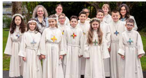
Erstkommunionkinder aus Strengelbach

Rückblick auf die Erstkommunionfeiern 2026 in Strengelbach und Zofingen