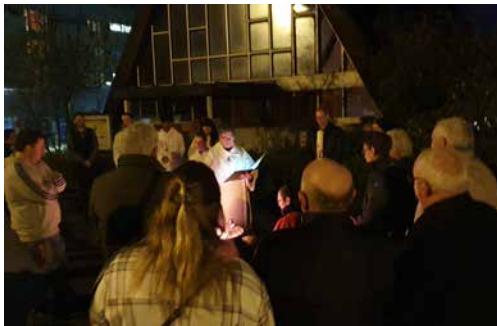
Am Osterfeuer vor der Kirche St. Paulus

Trotz Start um 6 Uhr früh, haben rund 60 Personen diesen ganz speziellen Ostergottesdienst besucht. Viele davon waren danach auch beim Brunch im Paulushuus dabei und der schmeckte in dieser frühen Morgenstunde besonders gut.