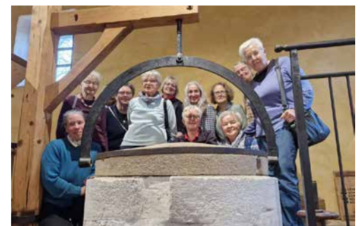
Die Besucherinnen posieren hinter der ehrwürdigen alten Mühle.