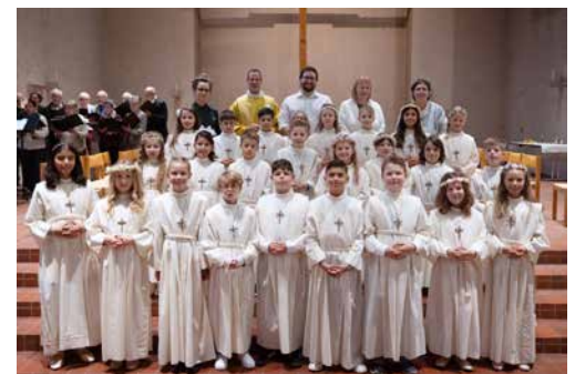
Bild: Erstkommunion 2026