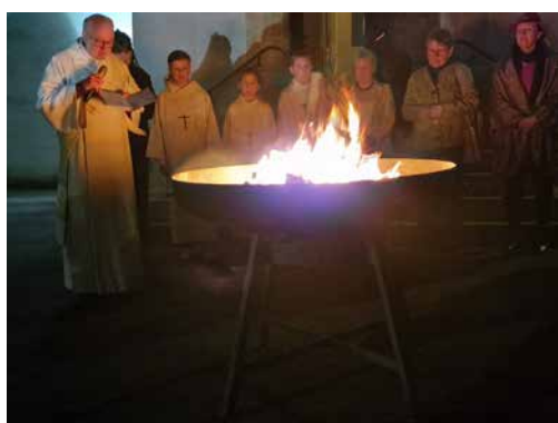
Ökumenische Osternachtfeier in Duggingen