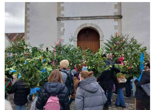
Vor dem Palmsonntagsgottesdienst in Aesch

Einige Impressionen vom Palmsonntag, Karfreitag und der Osternacht.