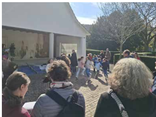
Familien-Kreuzweg am Karfreitag