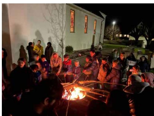
Schlangenbrot am Osterfeuer nach dem Osternachtgottesdienst in Pfeffingen