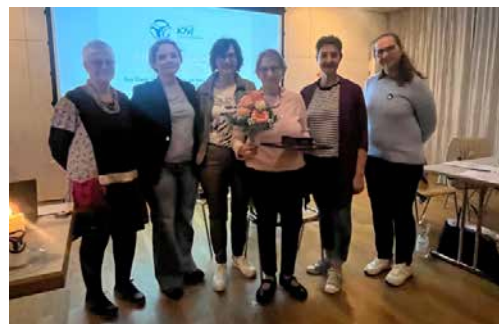
Die Generalversammlung des Katholischen Frauenbunds Aarau

Alle Veranstaltungen sind öffentlich – wir freuen uns über jeden Gast! Die genauen Termine und Orte werden rechtzeitig im Pfarrblatt „Lichtblick“ und möglicherweise im Landanzeiger bekannt gegeben.