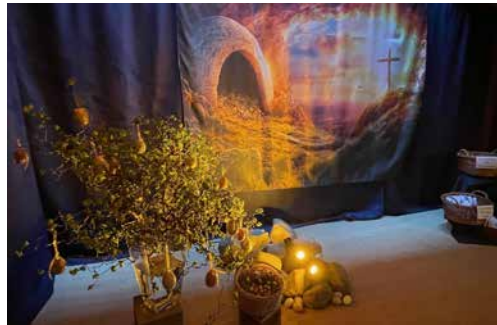
Osteroase in der Pfarrei St. Martin Entfelden

das Versprechen Jesus auch an uns, «Ich bleibe bei euch alle Tage bis zum Ende der Zeit.»