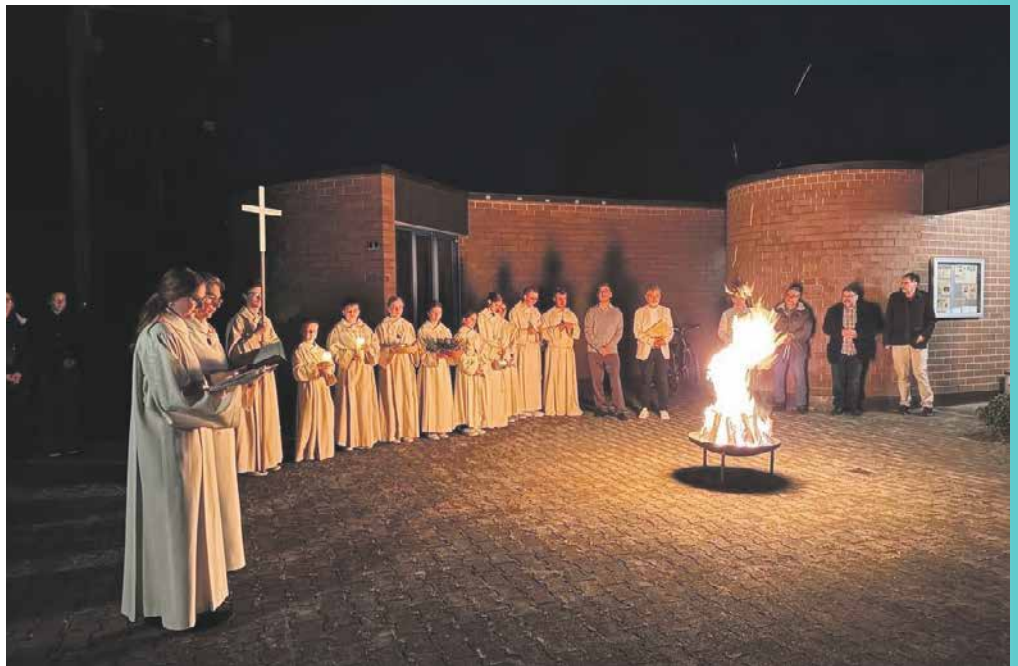
In vielen Pfarreien haben Osterfeuer lange Tradition. So auch im Kirchenzentrum Brugg-Nord in Riniken, wo die Osternachtsfeier um 21.30 Uhr am Feuer beginnt.

Das Feuer wird gesegnet, dann wird an ihm die Osterkerze entzündet. In einer feierlichen