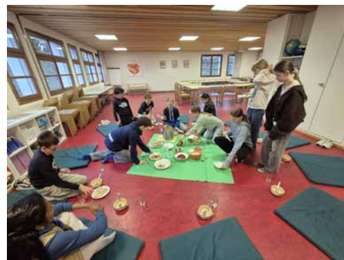
Die SchülerInnen beim gemeinsamen Essen in unserem Schulzimmer.

Mit viel Neugier und Begeisterung wurde gemeinsam gekocht: Auf dem Speiseplan standen unter anderem Hummus, Linsensuppe, Fladenbrot und Oliven. Einfache, aber typische Speisen aus der Zeit Jesu. Die Jugendlichen konnten dabei erfahren, wie eng Ernährung, Alltag und religiöses Leben miteinander verbunden waren. Das gemeinsame Kochen und anschließende Essen bereitete allen viel Freude und weckte großes Interesse. So wurde Geschichte lebendig und im wahrsten Sinne des Wortes „begreifbar“. Ein rundum gelungener Unterricht, der sicher noch lange in Erinnerung bleiben wird.