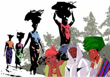
Titelbild 2026 Nigeria

Gefeiert wird die Liturgie am 6. März um 19 Uhr in der Kirche Rudolfstetten.