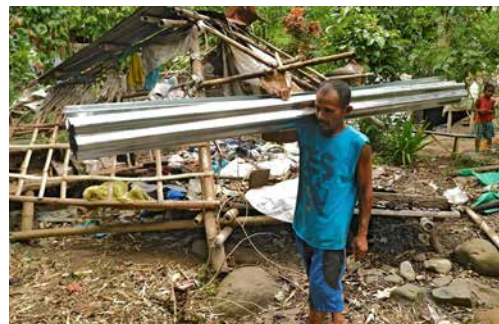
Philippinen SANCARLOS 2022