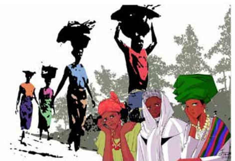
Bild: "Rest for the Weary" von der Künstlerin Gift Amarachi Ottah

Einmal im Jahr entsteht rund um den Globus ein besonderes Band der Verbundenheit: Am Freitag, 6. März 2026, feiern Menschen in über 150 Ländern den Weltgebetstag der Frauen. In diesem Jahr kommen die Gebete, Lieder und Impulse aus Nigeria, einem Land voller Energie, Gegensätze und tiefer Glaubenskraft. Nigeria ist jung, vielfältig und kreativ. Millionen Menschen unterschiedlichster Kulturen und Sprachen leben dort zusammen. Gleichzeitig ist der Alltag vieler Menschen von grossen Belastungen geprägt. Trotz natürlichem Reichtum und wirtschaftlichem Potenzial