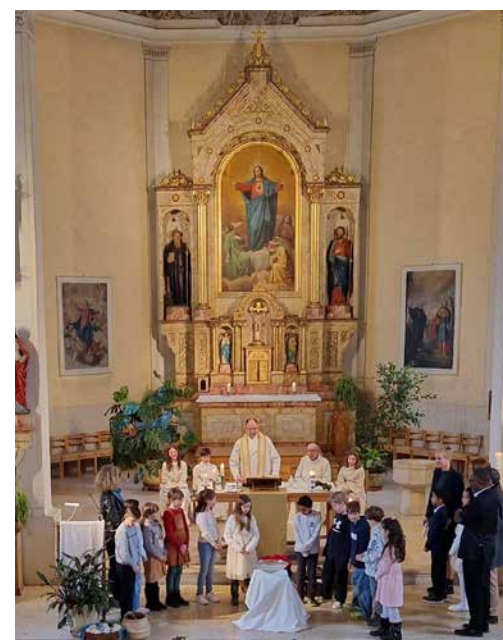
Erstkommunionkinder 2026 und Täuflinge in der Pfarrkirche St. Gallus, Hochwald am 8.2.2026, Taufferinnerung