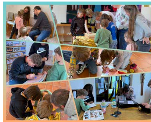
Eine Station auf dem Versöhnungsweg 2026, offen für alle Generationen

Am Montag, 23. Februar bleibt das Sekretariat den ganzen Tag geschlossen. Dienstag - Freitag sind wir wie gewohnt für Sie da. In dringenden seelsorgerlichen Notfällen erreichen Sie uns unter 076 473 09 49.