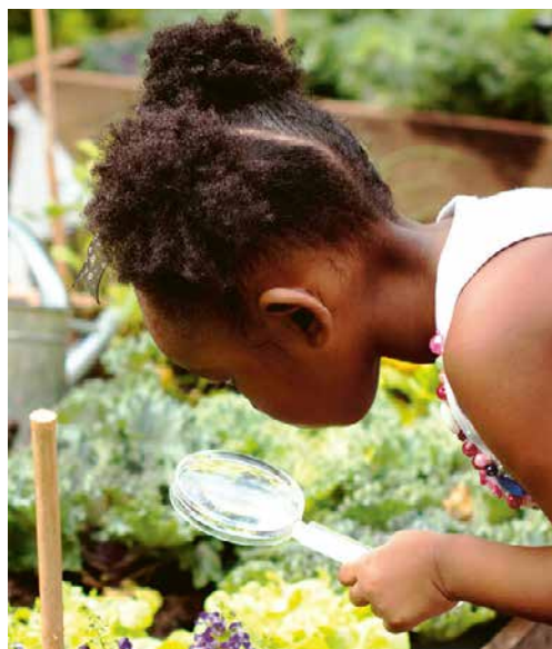
Ausschnitt aus Jumi Nr. 4 , Februar/März

Web: www.rkk-arlesheim.ch Pfarrei Arlesheim