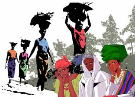
Titelbild 2026 Nigeria Ruhe für die Erschöpften, von Gift Amarachi Ottah

Jedes Jahr am ersten Freitag im März laden sie alle zum Feiern eines gemeinsamen Gebetstages ein. Durch die Gemeinschaft im Beten und Handeln sind die Menschen aus vielen Ländern auf der ganzen Welt miteinander verbunden.