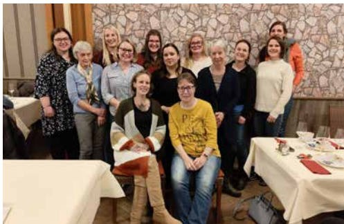
«Neu-Aufgenommene» und «Schnuppermitglieder»

Am Dienstag, 3. Februar, fand im Restaurant Anker die 28. Generalversammlung der Frau-