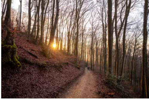
Samstag, 28. Februar, 9.00 - 12.00 Uhr, Treffpunkt vor der Röm.-Kath. Kirche Rheinfelden, Gehzeit ca 1.5 Std. Mitbringen: etwas Kleines für ein geteiltes Znüni-Büf-fet

Wir freuen uns auf gwundrige Pilger*innen.