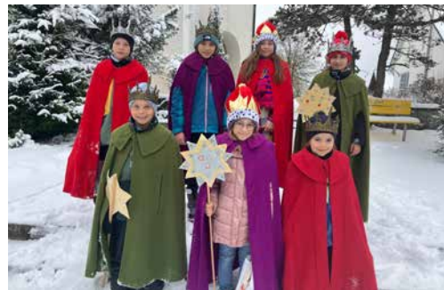
Frierend, aber motiviert!