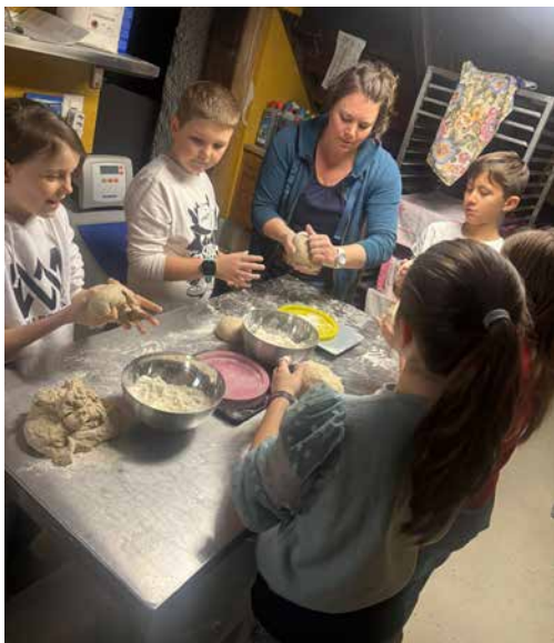
Gruppe 1 beim Brotbacken

tolle Möglichkeit des Brotbackens und den Gottesdienstbesuchern für die Unterstützung.