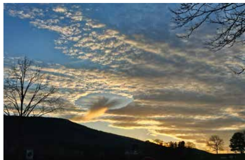
Text und Bild Elisabeth Borer

Ich wünsche Ihnen allen ein Umfeld mit verständnisvollen Menschen und die Erkenntnis, dass jeder für andere ein Halt, ein Lichtblick sein kann.