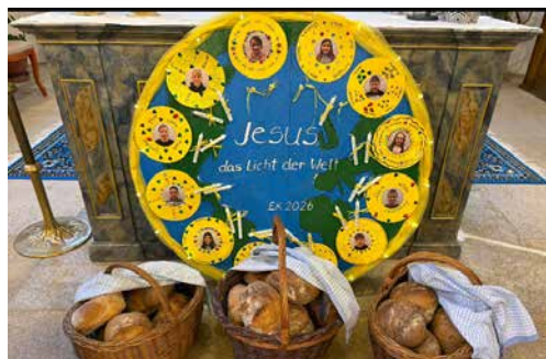
Gebackenes Brot in der Kirche Nenzlingen