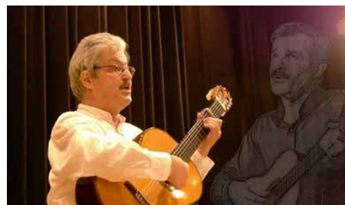
Das Team «Horizonte» der Kath. Pfarrei und Ref. Kirchengemeinde Münchenstein