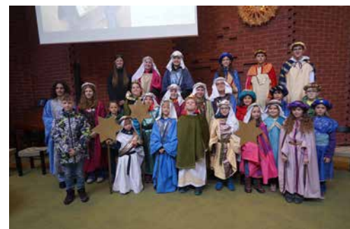
Sternsinger aus Kleindöttingen und Leuggern

Ein herzlicher Dank gilt allen, die in diesem Jahr als Sternsinger unterwegs waren.