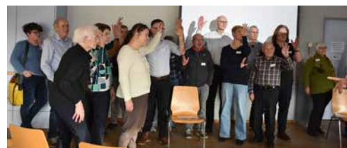
Allenthalben Interesse und aktive Mitwirkung im Zwischenhalt

Über die Ergebnisse der Umfrage, über den Zwischenhalt-Nachmittag und den Zukunftsprozess wird laufend informiert werden, zum Beispiel via Pastoralraum-Website.