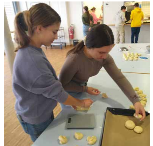
9 Jugendliche haben am Samstagmorgen...

Vom 3. bis 11. Januar waren einige Sternsinger-Gruppen in unserer grossen und weitläufigen Pfarrei unterwegs. Leider konnten sie nicht alle Haushalte besuchen. Falls Sie sie vermisst und noch keinen Segenskleber erhalten haben, in der Kirche Leuggern liegen beim Haupteingang noch einige zum Mitnehmen bereit.