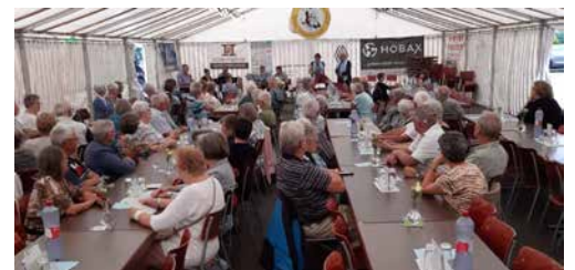
Juli: Ökumenischer Gottesdienst zum Spa-Pi-Wei-Ba-Fest in Schwaderloch