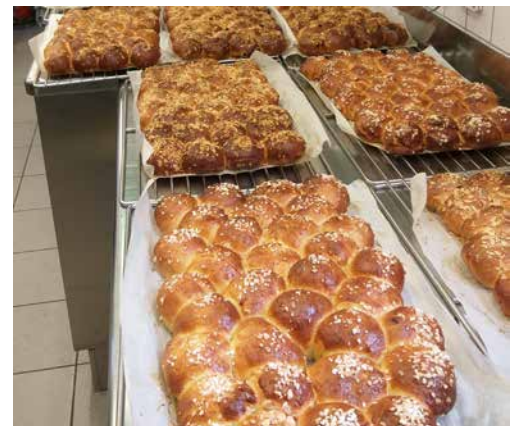
fleissig geknetet und für uns gebacken!

Die feinen Dreikönigskuchen für den anschliessenden Chilekafi wurden traditions-gemäss in der Küche des Pfarreiheims Lupe in Leuggern gebacken.