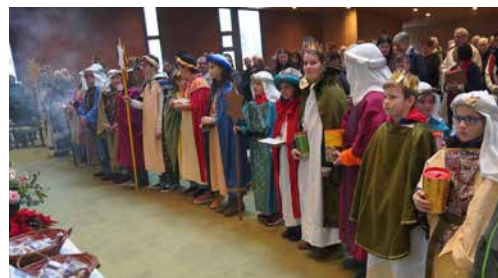
beim Gottesdienst in Kleindöttingen

Den diesjährigen Sternsinger-Gottesdienst feierten wir am 11. Januar zusammen mit der Pfarrei Kleindöttingen in der Antoniuskirche in Kleindöttingen.