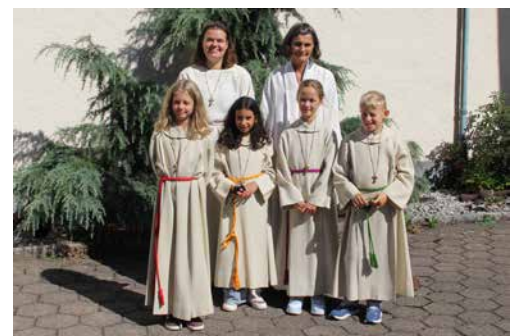
August: Miniaufnahme in Schwaderloch