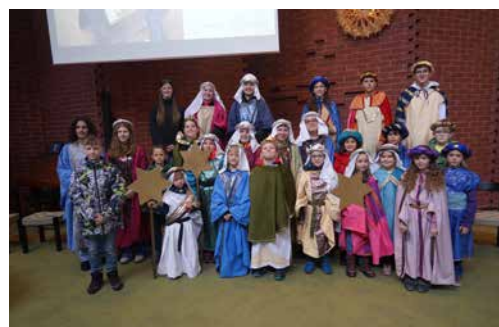
Kleindöttingen + Leuggern

Herzlichen Dank an ALLE Kinder, Jugendlichen und Begleitpersonen, welche dieses Jahr in den Dörfern als Sternsinger unterwegs waren.