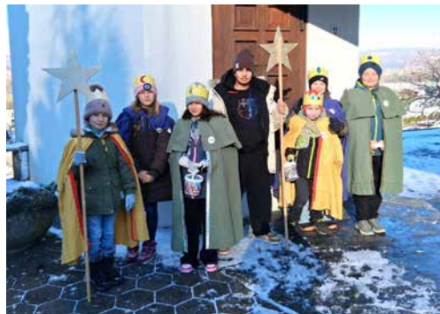
Die Sternsingerinnen und Sternsinger aus Schwaderloch.