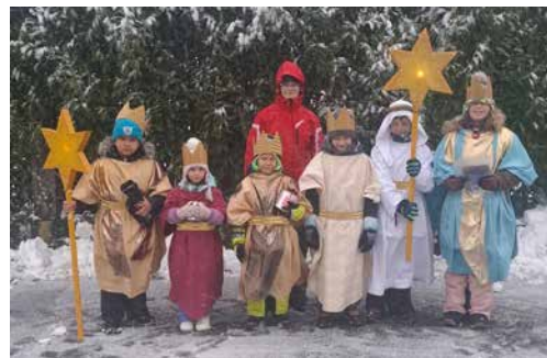
Sternsinger-Gruppe aus Reuenthal

Den diesjährigen Sternsinger-Gottesdienst feierten wir am 11. Januar zusammen mit der Pfarrei Kleindöttingen in der Antoniuskirche in Kleindöttingen.