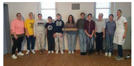
Dafür sei herzlich gedankt! Auch an die beiden Backprofis Silvia Schmid und Nicole Nydegger

Text: Daniela Kalt, Fotos: Silvia Kaiser, Nicole Nydegger, Daniela Kalt