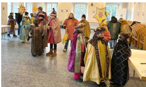
Die Sternsinger beim Vorbereiten.

Bei Schnee, Wind und eisigen Temperaturen zogen die Gruppen als Kaspar, Melchior, Baltasar und Sternträger los. Mit viel Elan, Fleiss und Freude gingen sie von Haus zu Haus und brachten den Segen, schrieben mit gesegneter Kreide an die Haustüren oder brachten den Aufkleber mit der Segensformel 20°C+M-B+26 (Christus mansionem benedicat – Christus, segne dieses Haus) an.