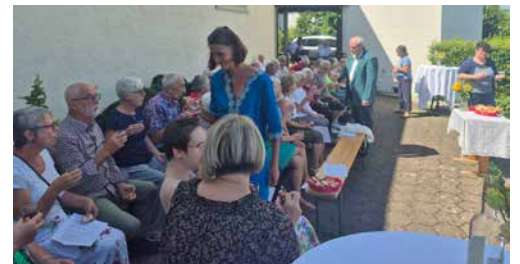
Juni: Maria-Magdalena-Gottesdienst mit Teilete in Schwaderloch