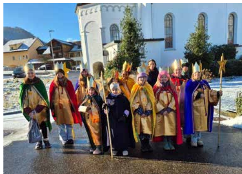
Die Sternsingerinnen und Sternsinger aus Leibstadt.

Unter dem Motto «Schule statt Fabrick» standen bei der diesjährigen Aktion die Kinderarbeit im Fokus. Dank dem Engagement der Sternsingerinnen und Sternsinger erhalten Kinder in Bangladesch neue Hoffnung – raus aus ausbeuterischer Arbeit, hinein in Bildung und eine würdige Zukunft. Dafür wurde von unseren Sternsingerinnen und Sternsinger in Leibstadt Fr. 2135.17 und in Schwaderloch Fr. 1039.00 gesammelt. Herzliche Dank für die grosszügigen Spenden.