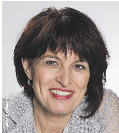
Doris Leuthard war von 2006 bis 2018 Bundesrätin und zweimal Bundespräsidentin.