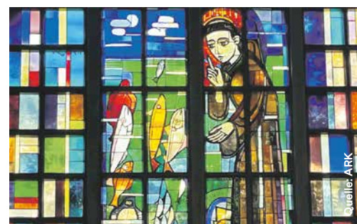
Das Fenster zeigt die Szene, wie der heilige Antonius den Fischen predigt.

Das Gesamtkonzept dieser ersten reinen Betonkirche, die 1925–1927 erbaut wurde, stammt