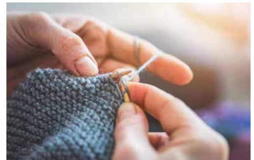
Donnerstag, 8. Januar 2026, 14 Uhr, Monatshöck der Frauengemeinschaft im KiZ Windisch

Die Strickwaren werden jeweils dem Hilfswerk «Helfen Sie helfen» in Hüttikon übergeben. Zweck des Vereins ist es, Hilfsgüter aller Art sowie Spendengelder durch uneigennützige Aktivitäten zu sammeln. Diese werden vollumfänglich armen, kranken und besonders hilfsbedürftigen Menschen im In- und Ausland zur Verfügung gestellt. Alle Helfer arbeiten unentgeltlich. Ziel ist es, dort zu helfen, wo die Not am grössten ist. (pr)