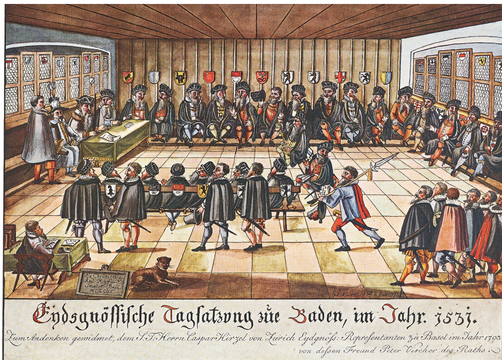
Die Disputation wurde von der Tagsatzung der Eidgenossenschaft einberufen. Sie tagte – wie hier 1531 – regelmässig in Baden. Abbildung: Die Tagsatzung Baden, Stadtarchiv Baden, Historisches Museum Baden.